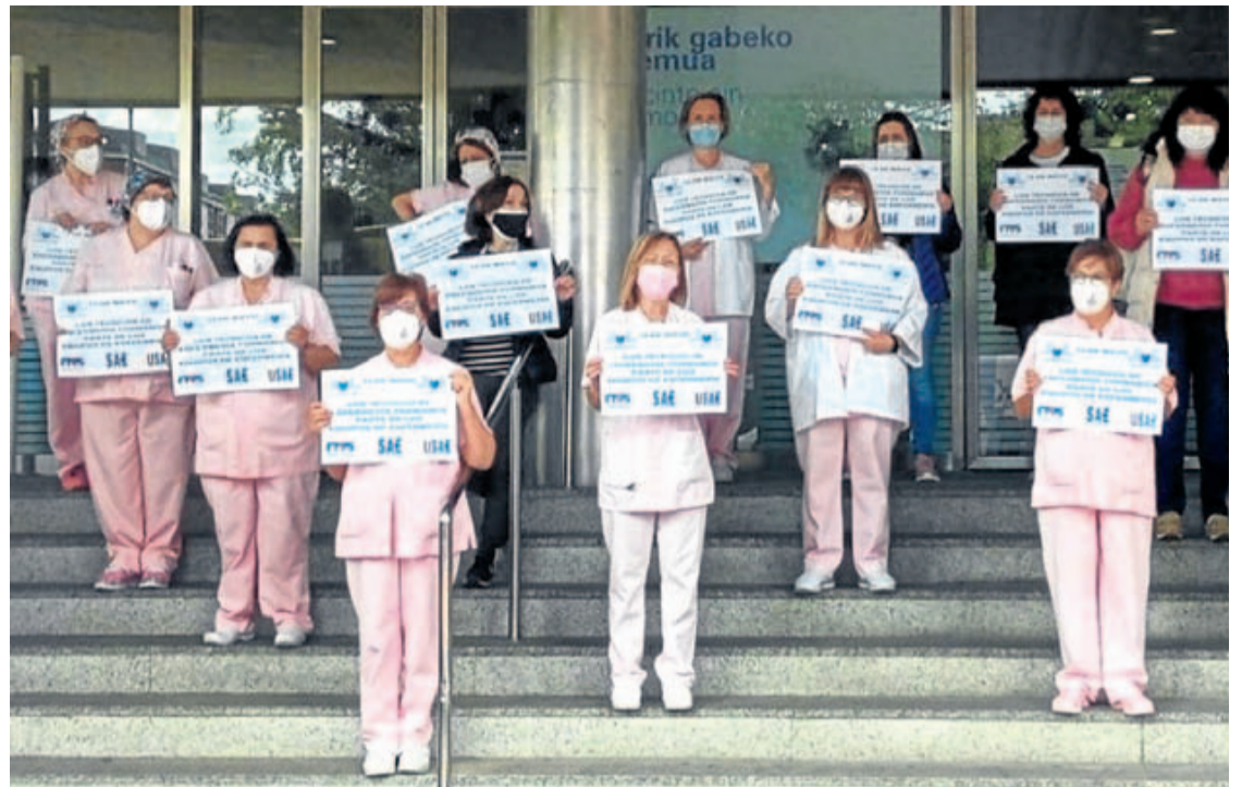
Los técnicos en cuidados de Enfermería participaron ayer en concentraciones para visibilizar al colectivo.

Fuentes de la sección sindical de LAB reconocieron a este periódico que este tipo de cambios suelen ser «complicados», pero subrayaron que lo que se ha vivido estos días han sido un «desmadre» que ha repercutido directamente sobre los usuarios y sobre los trabajadores. Además, fuentes de Ambuibérica apuntaron que han decidido recurrir la adjudicación ante los juzgados de lo Contencioso Administrativo. Lo hace después de que el Órgano Administrativo de Recursos Contractuales (OARC) rechazase su primer recurso, en el que insiste en que la oferta de su competidora es «técnica y económicamente inviable», lo que impediría cumplir con el servicio en los «niveles de calidad requeridos en los pliegos».