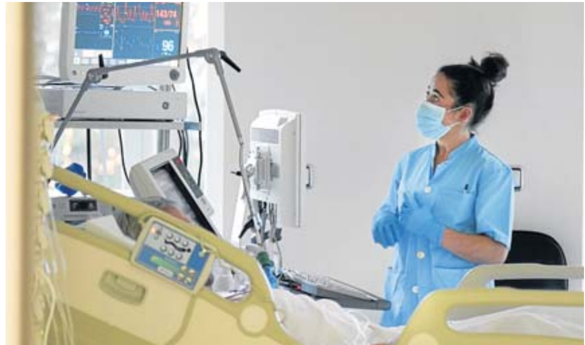
Una enfermera atiende a un paciente en la unidad de críticos del Hospital Donostia.