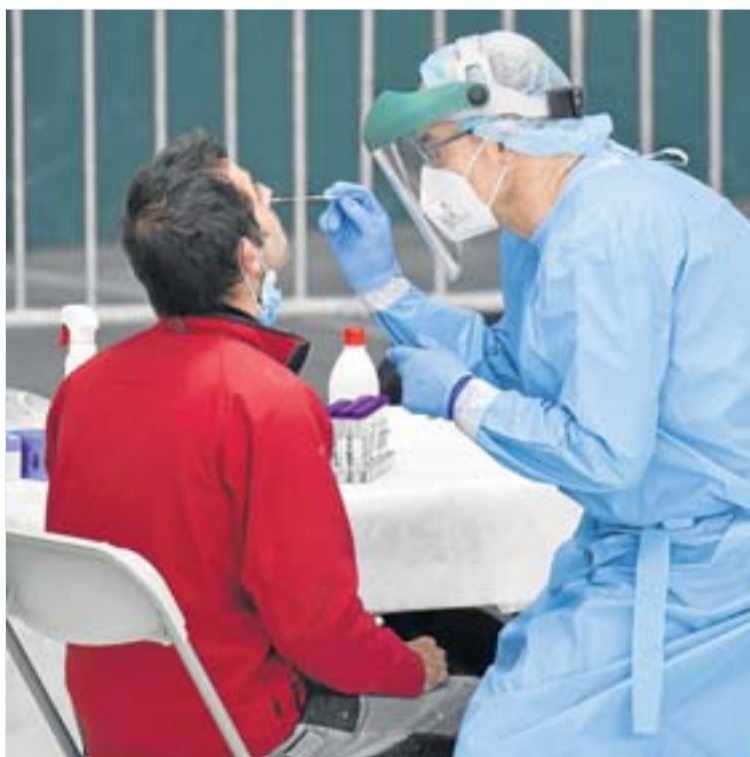
Un sanitario realiza una PCR en un cribado. IÑIGO ROYO

nuevos casos hubo entre los menores de 12 años. 26 entre 0-2 años, 19 entre 3-5 años y 69 entre 6-12 años. La tasa media de las 3 franjas es de 412