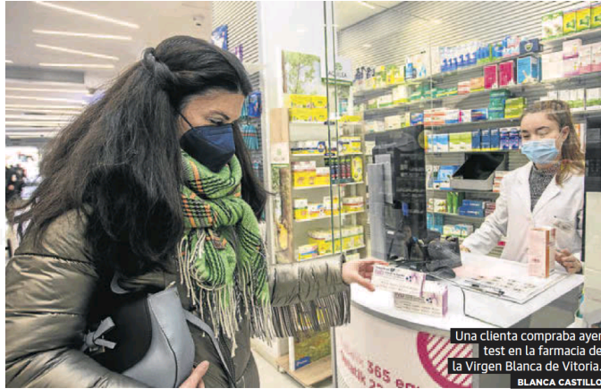
Una cliente compraba ayer test en la farmacia de la Virgen Blanca de Vitoria.

Entre los profesionales cunde el cansancio y en Salburua abren sus agendas como muestra, con 63 pacientes para una enfermera y unos sesenta también para un médico un día cualquiera, elegido al azar, como el pasado 3 de enero. Al principio de la crisis sanitaria rondaba el medio centenar de consultas por profesional.