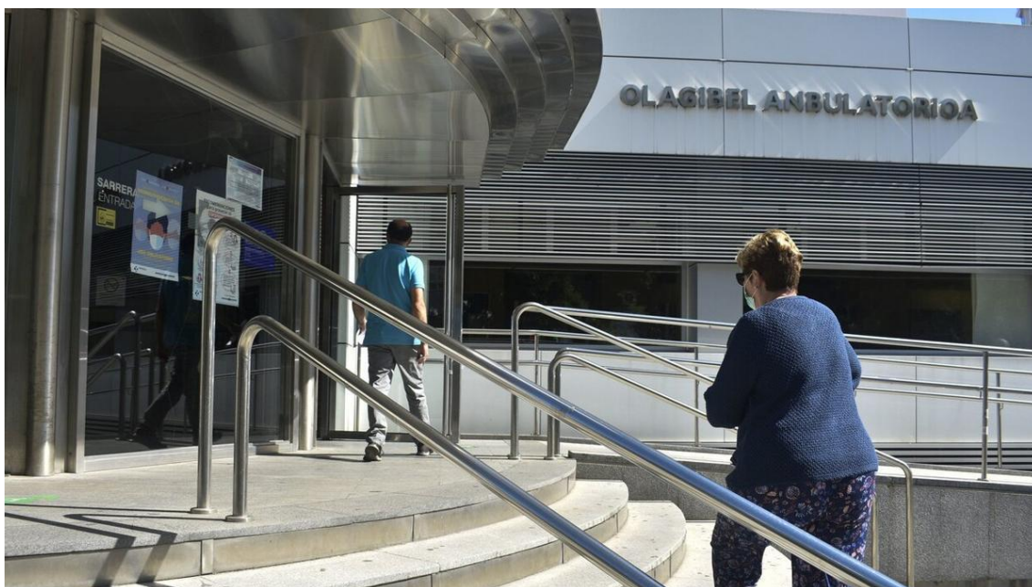
Personas en el ambulatorio de Olagibel.