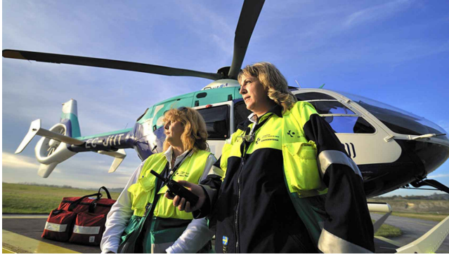
Trabajadoras del Servicio de Emergencias/Osakidetza