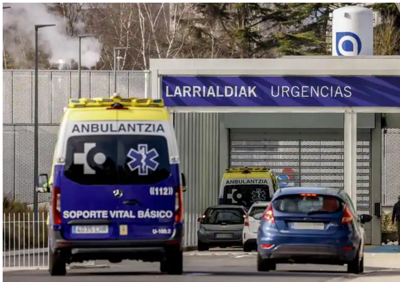
Exterior de las urgencias del HUA Txagorritxu, en Vitoria. Jesús Andrade

El adelanto en el horario de cierre del 80% de los ambulatorios de Vitoria, el 'pico' de patologías respiratorias y el incremento de la carga de trabajo llenan las emergencias con decenas de pacientes