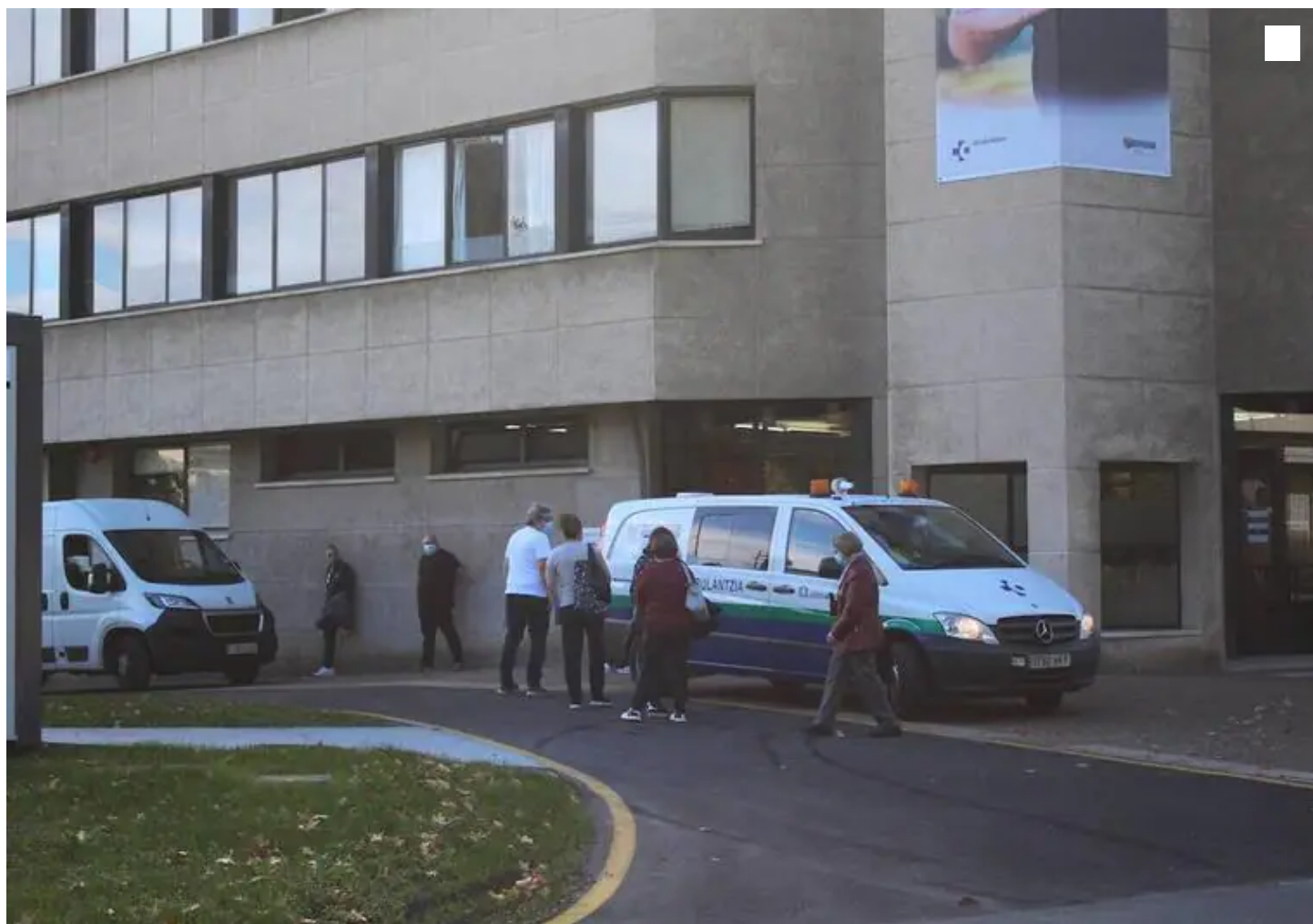
El paciente falleció el viernes por la noche en el Punto de Atención Continuada (PAC) de Llodio. Sandra Espinosa

La denuncia llega tras el fallecimiento de un paciente en el PAC de Llodio el pasado viernes